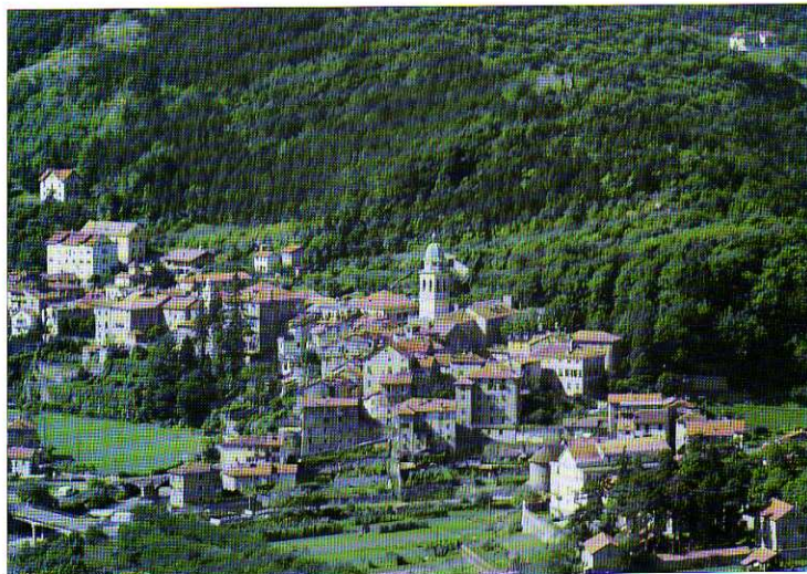
TAV. XXV - Il compatto nucleo centrale del Borgo, sul contrafforte che segna la confluenza del Morsone nel Lemme.