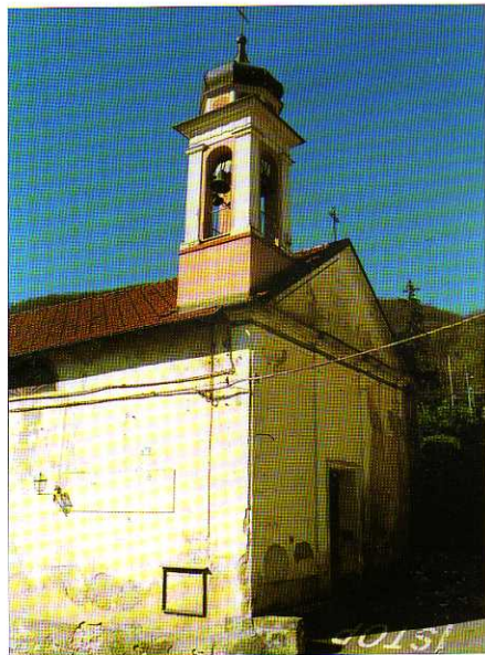
TAV. XVIII - Esterno dell'Oratorio di S. Antonio Abate, già testimoniato come "Oratorium vicinum portae Vultaggi" nel 1585.