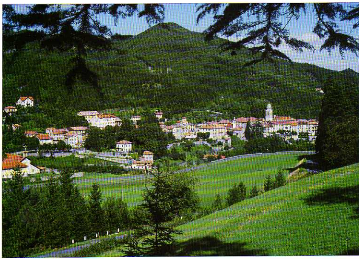
TAV. XXVII - Voltaggio dalla strada della Castagnola.