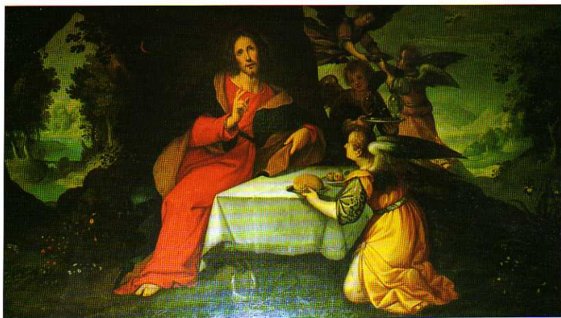
TAV. XX - Convento dei Cappuccini. Gesù servito dagli Angeli (Sinibaldo Scorza, secondo decennio del XVII secolo).