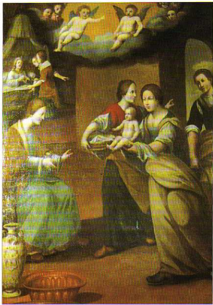
TAV. XVII - Oratorio del Gonfalone. Natività della Vergine (Bernardo Carrosio, 1631).