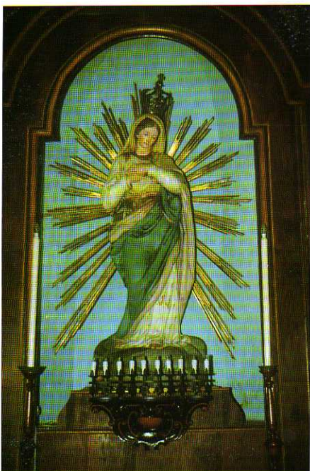
TAV. XXI - Convento dei Cappuccini. Immacolata (scultura lignea policroma di Bartolomeo Carrea, fine del XVIII secolo).