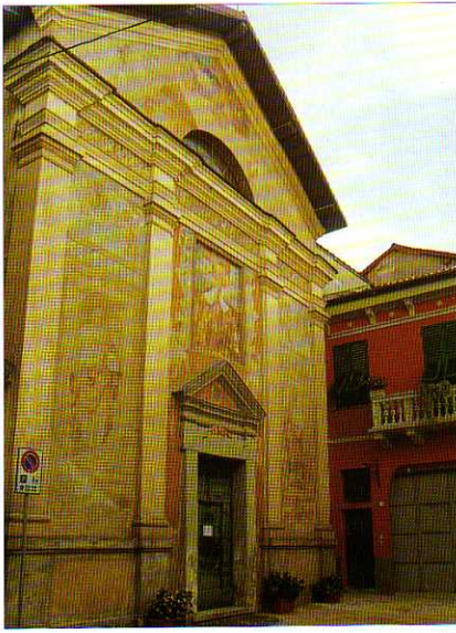
TAV. XIV - Frontale dell'Oratorio di N.S. del Gonfalone (seconda metà del XVII secolo).