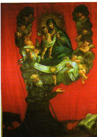
TAV. XIX - Oratorio di S. Antonio Abate. Stendardo processionale (seconda metà del XVII secolo).