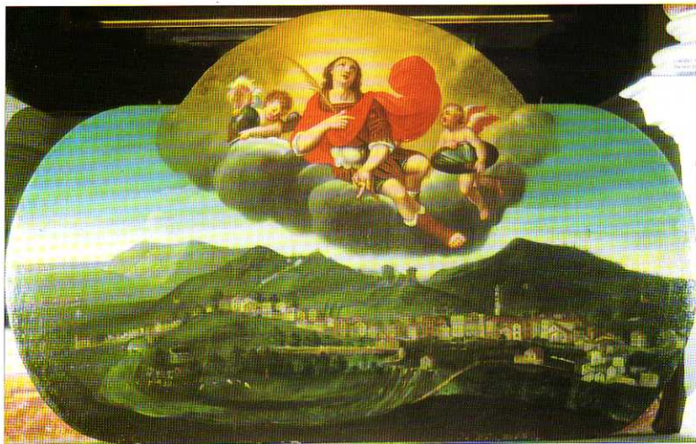
TAV. XVI - Oratorio del Gonfalone. Traslazione delle reliquie di S. Clemente Martire (Bartolomeo Agosti, 1682).