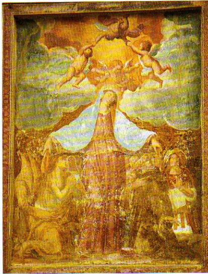
TAV. XV - Madonna del Gonfalone. Affresco sul frontale dell'Oratorio omonimo (Pantalino e Bartolomeo Agosti, 1680).