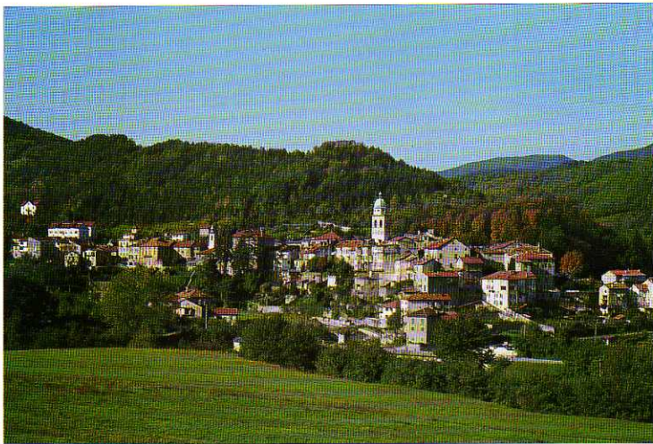
TAV. XXVIII - Voltaggio visto da est.