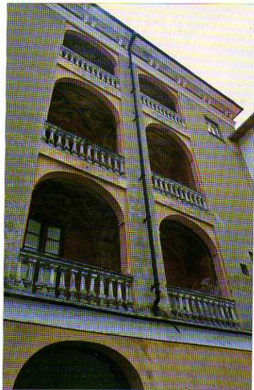
TAV. XXII - Il loggiato di Palazzo Scorza, casa natale del pittore Sinibaldo.