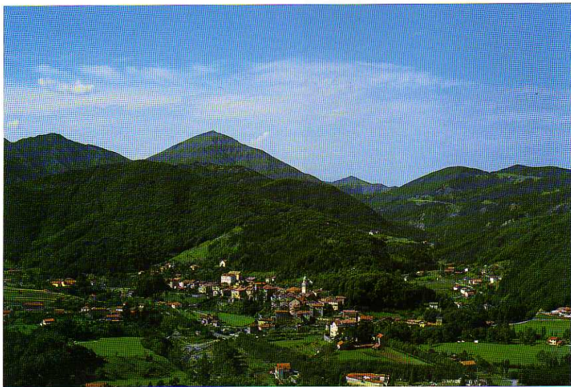
TAV. XXIV - Viaggio da Nord-Est. Sullo sfondo sventa la mole del Monte Tobbio.