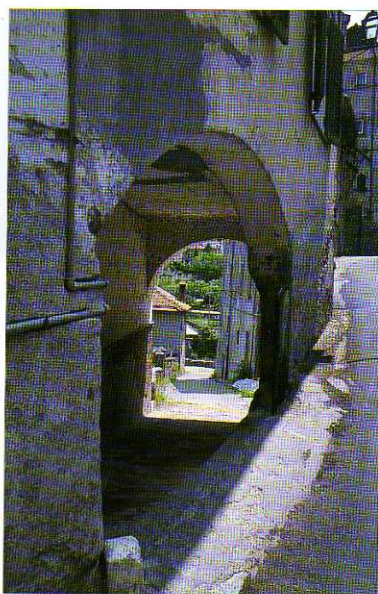
TAV. XXIII - Una suggestiva inquadratura dell'archivolta aperto sul vicolo che conduce al borgo dei Paganini.